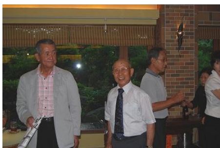
今日はお任せあれ