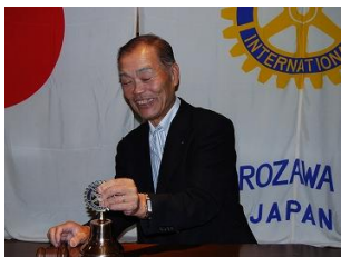
最後の点鐘 いい響き♪