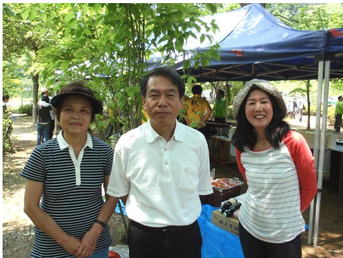
綺麗になったロータリーの森。 後ろから焼肉のいいにおいが~~~~~。