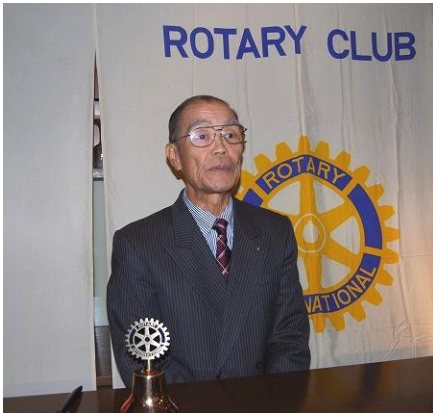
上野パト会長 新年のご挨拶