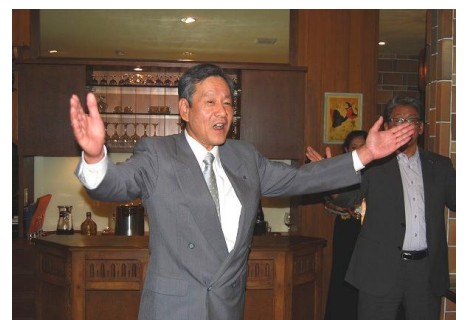
気合を入れて頑張るぞ!!