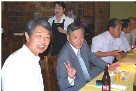
次年度はおまかせ