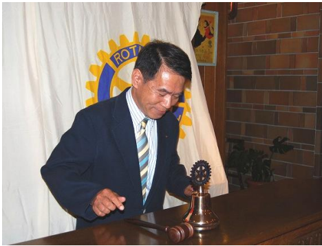
最後の点鐘 頑張っています。