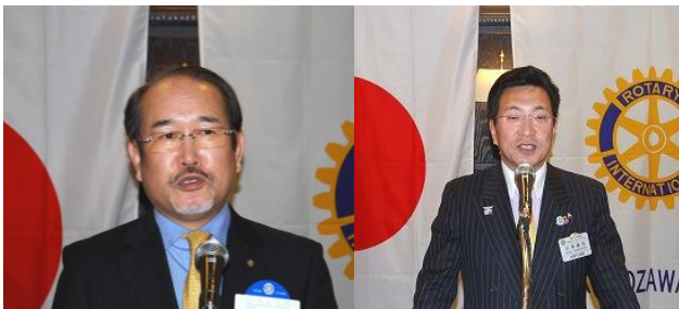
茂木 正 ガバナーエレクト様